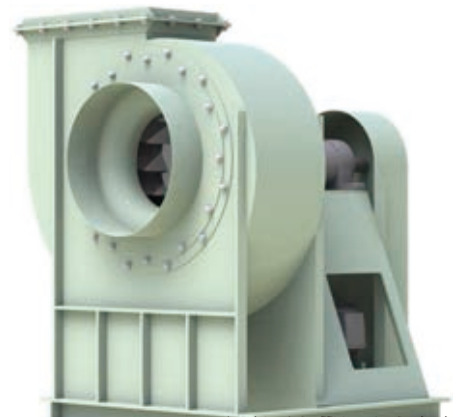
B74系列外觀示意圖 B74 SERIES IMAGE