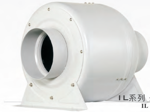
IL系列 外觀示意圖 IL series image